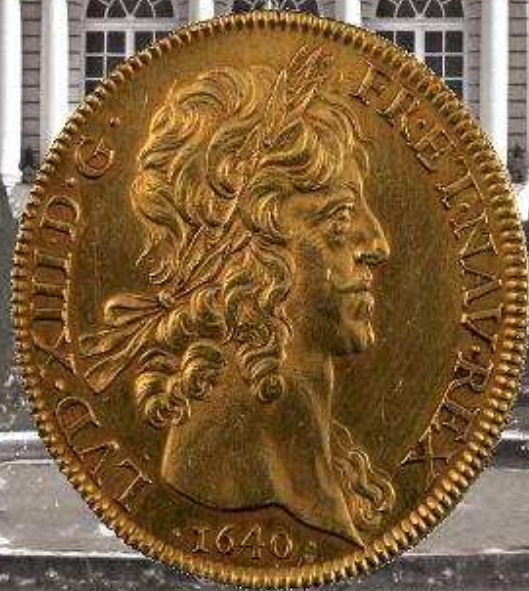
Pièce de plaisir de Louis XIII