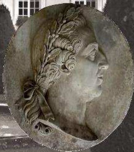
Profil du bien-aimé roi Louis XV