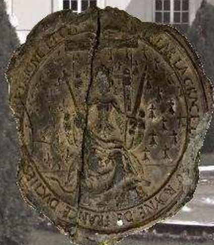
Grand sceau de deuil d'Anne de Bretagne