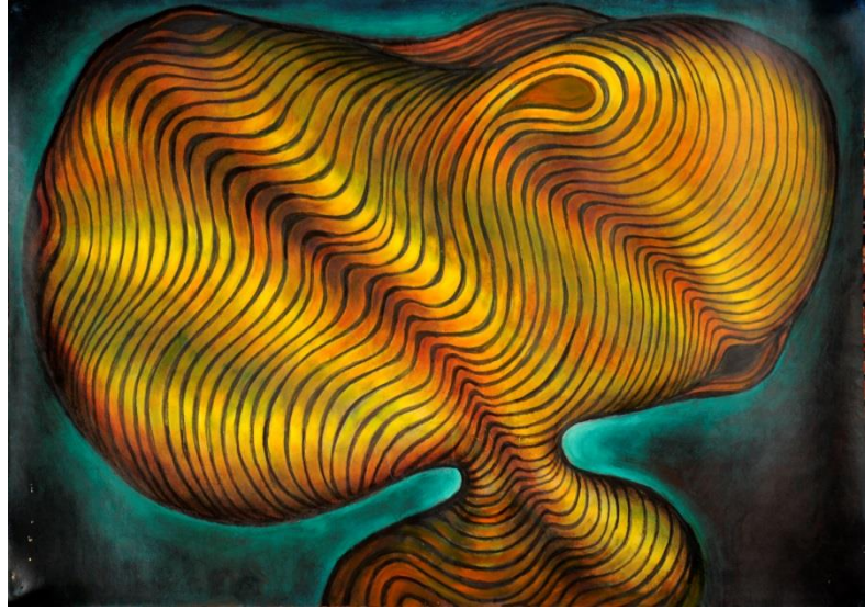
Chomo, Mutant, 1996, 75 x 105 cm