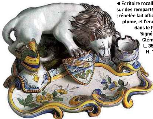
◀ Écritoire rocaïlle, motif de lion sur des remparts. La tour crénelée fait office d'essuie plume, et l'encrier est dans le heaume. Signé Saint-Clément. L. 35 cm, H. 17 cm.

Répertoriées partout en France, voici une sélection des ventes aux enchères prévues prochainement.