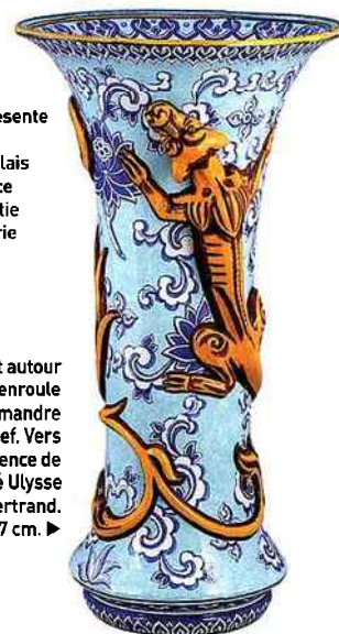
▶ Vase cornet autour duquel s'enroule une salamandre en relief. Vers 1860, en faïence de Gien. Signé Ulysse Bertrand. H. 57 cm.