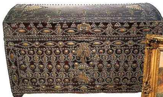
◀ Coffre de la fin du xvii e siècle, en cuir clouté. L. 1,07 m, l. 47 cm, H. 62 cm.

Lundi 8 et 15 février, à 14 h, à l'hôtel des ventes, route de Blois, 41100 Vendôme. Exposition les 6 et 13, de 10 h à 12 h et de 14 h à 17 h ; les 7 et 14, de 14 h 30 à 17 h ; les 8 et 15, de 10 h à 12 h. Rouillac. Tél. 02 54 80 24 24.