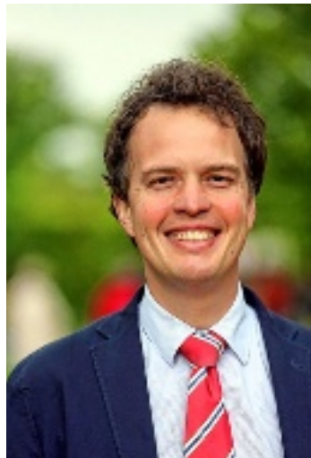
M e Rouillac.

Cette semaine, Éric Soumet à l'expertise d'Aymeric Rouillac un niveau longue portée de la marque Henri Morin.